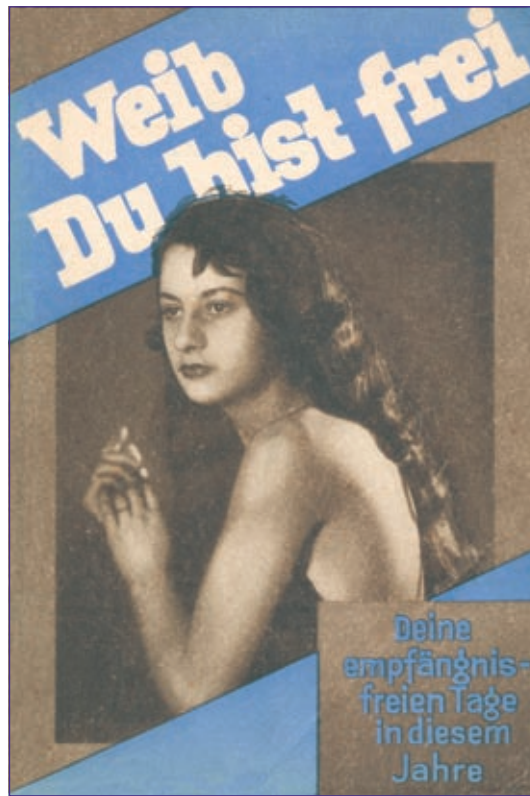
Buchtitel von Ale von Paas, „Weib du bist frei – Deine empfängnisfreien Tage in diesem Jahr“, 1930.

Trotz der großen Fortschritte gibt es nach wie vor viele Beispiele für weiter anhaltende Bevormundungen, die Frauen daran hindern, ihre Fruchtbarkeit bestmöglich zu regeln. So ist der Verkauf der Pille nach wie vor von der Verschreibung durch einen Arzt/einer Ärztin abhängig, obwohl dies nur schwer sachlich begründbar ist. Auch die anhaltende Diskussion über die rezeptfreie Abgabe der ‚Pille danach‘ zeigt eindrücklich, wie stark die patriarchalen Kräfte der Bevormundung auch im 21. Jahrhundert noch sind. Alle medizinischen Fakten sprechen für die rezeptfreie Abgabe dieser Notfallverhütung, weshalb dies in den meisten westeuropäischen Ländern bereits seit mehreren Jahren umgesetzt wurde – mit sehr guten Erfahrungen. Trotzdem ist das derzeit in Deutschland und Österreich politisch unmöglich.